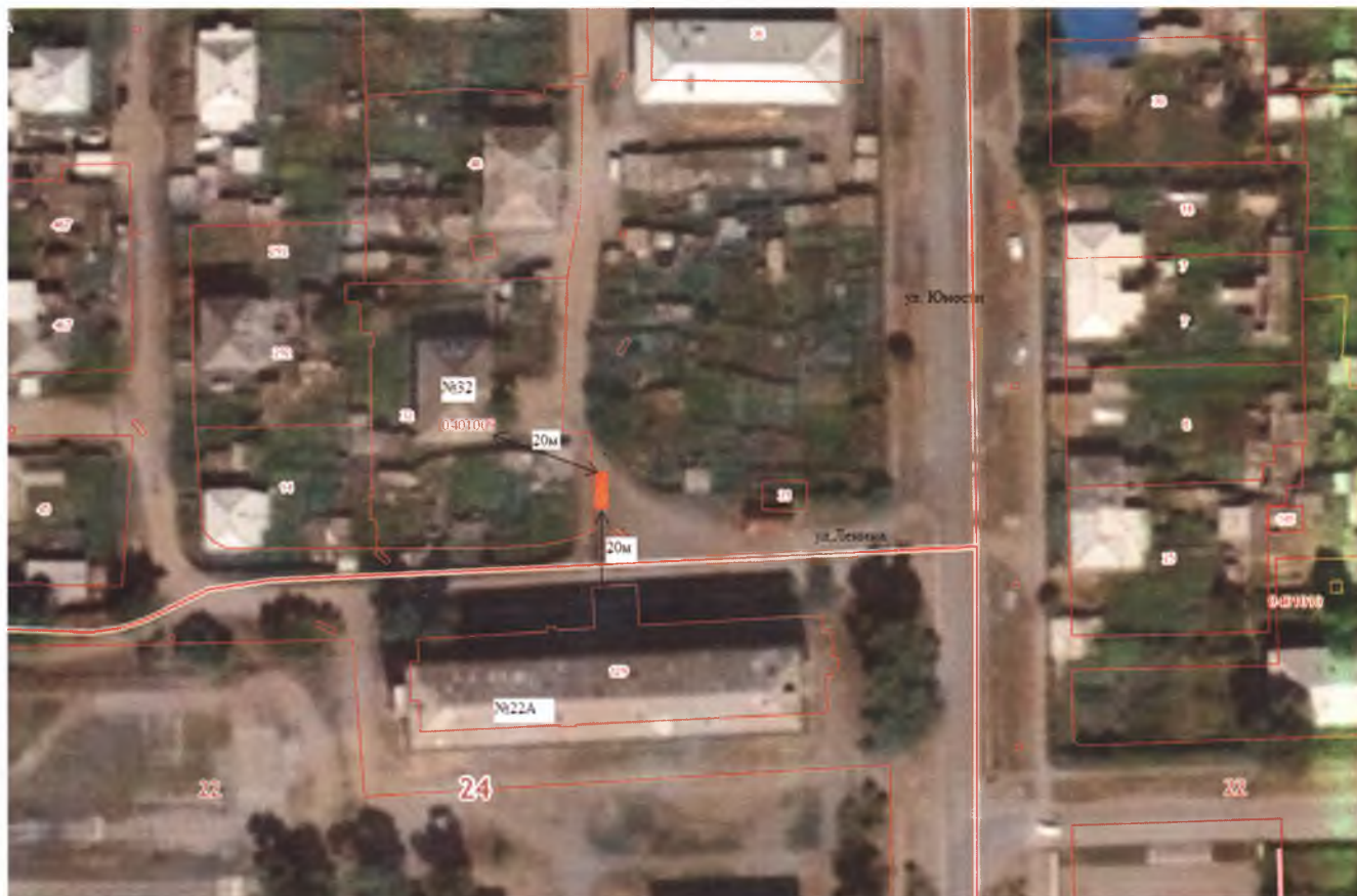
Схема размещения контейнерного оборудования в с. Краснотуранск по ул. Ленина 22 А